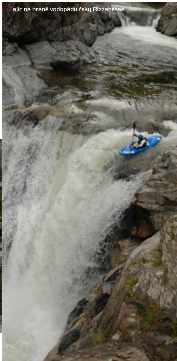
Zajíc na hraně vodopádu řeky Rizzanesse

Č: Důležitý je se snažit. Spousta lidí by strašně chtěla, ale vůbec nic pro to nedělají. Je třeba dobrý si sepsat, co jsi ve svojí kariéře dokázal, a někam to poslat. Dál taky musíš něco nabídnout, oni něco