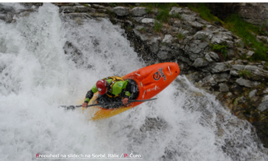
Freewheel na slidech na Sorbě, Itálie