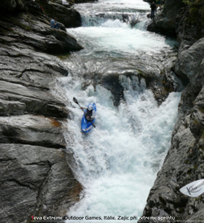
Teva Extreme Outdoor Games, Itálie. Zájíc při extreme sprintu

Z: Rozhodně je těžší je získat. Když už v té firmě jednou jseš, tak už si jí udržíš docela dobře.