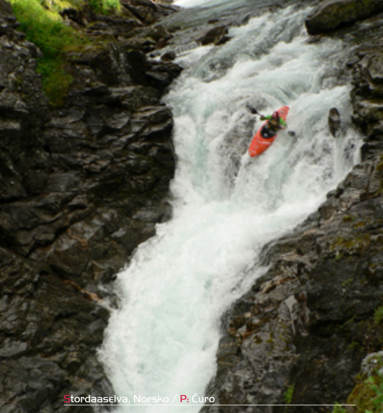
Stordaaaselva, Norsko