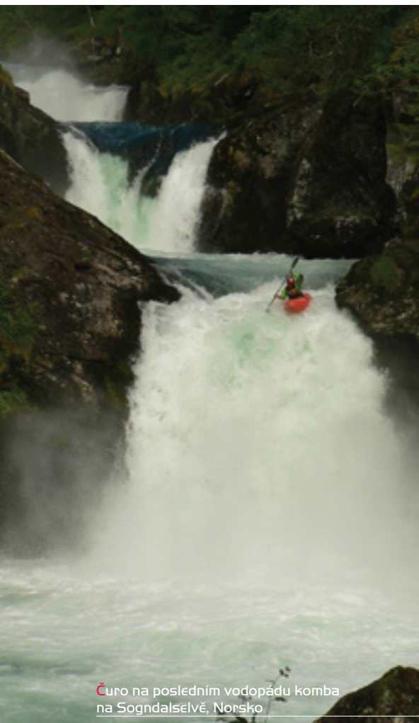
Čuro na posledním vodopádu komba na Sogndalselvě, Norsko

Č: Já to mám teď rozhodně lepší. Když chci získat peníze na jídlo nebo na letenku, tak pro to musím