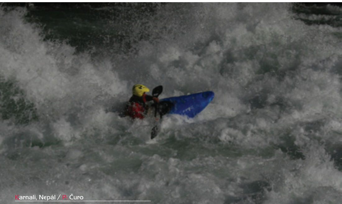
Karnali, Nepál